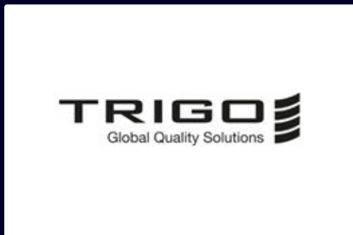
Filiale TRIGO Group

Spécialistes de l'IA pour le contrôle qualité industriel. Nous simplifions l'inspection visuelle complexe.